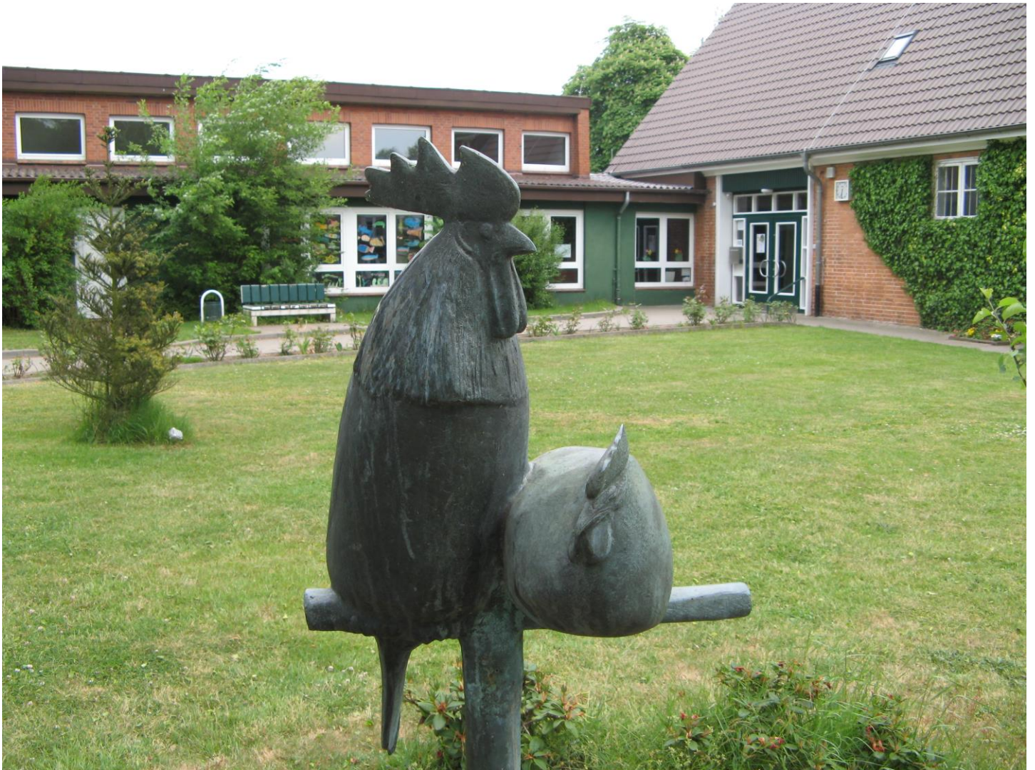
V. i. S. d. P.: Grundschule Kuddewörde Möllner Straße 3 22958 Kuddewörde Stand: Mai 2015